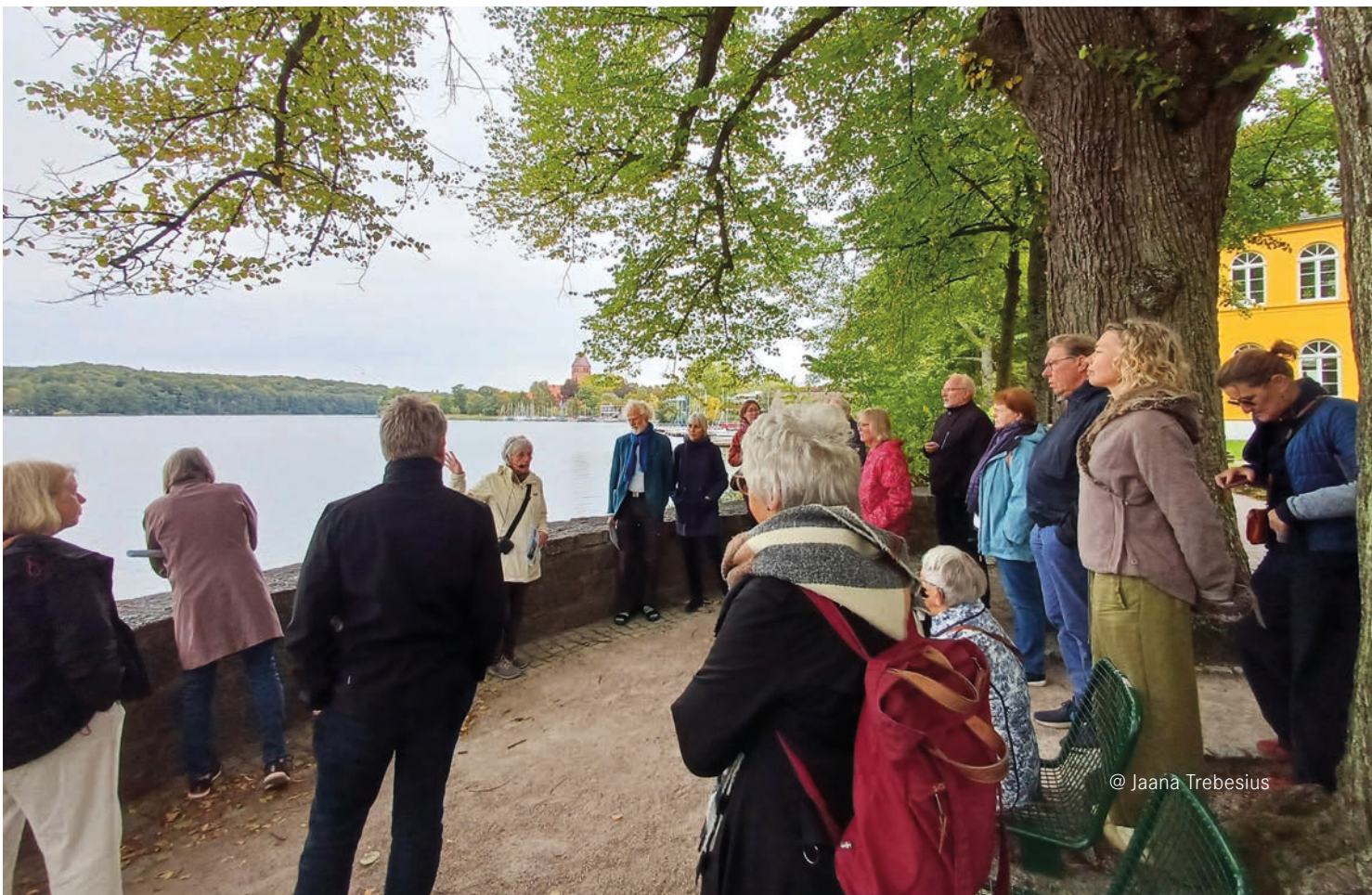
@ Jaana Trebesius